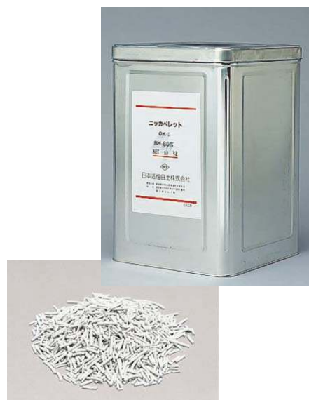
グリース缶品(バラ品)